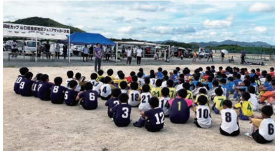
参加した選手たちは力いっぱい戦い、最後まで戦い抜きました。

UBEカップ 第47回 山口県西部地区ジュニアサッカー大会 -UBE(株)・宇部サッカー協会主催- 9月15日(日)