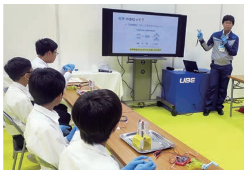
みらいWalkers★UBE 出展時の様子

UBE(株)では、UBEふれあい祭りや夏休みジュニア科学教室、社会見学といった様々な行事で地域の子供たちと交流しています。10月には宇部市依田翁記念体育館で開催された「みらいWalkers★UBE」に出展し、市内在住の中学生を対象に、燃料電池を作る化学実験を通し、化学の奥深さや楽しさを体験していただきました。