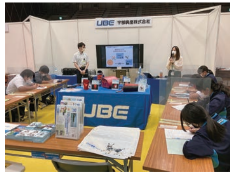
当社ブース内の様子

2021年10月6、7日の2日間に渡って開催された職業体験イベント「miraiwalkers UBE」に出展しました。宇部市内24の企業・団体が依田翁記念体育館にブースを出し、市内の中学2年生がそれぞれのブースで職業体験をしました。各々の感想をにこやかにUBEのブースでは「製話」姿が印象的でした。この体験を通して働くことへの面白さや、製品開発の仕事の魅力を伝えることができていた嬉しさです。