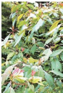
→サッサフラスの木。 木全体に柑橘系の芳香がある。

ヘリオフレッシュ 香水やトイレタリー用品などでよく使われる、爽やかな香りが特徴のマリン系香料ですが、従来はクスノキ科の木