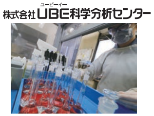
株式会社UBE科学分析センター

の通勤者で、地元根差した企業です。また、女性社員が約半数を占めるため、短時間勤務や時間単位年休の制度を早くから導入し、多くの方に活用されています。山口県の「やまぐち子育て応援企業」「健康経営企業」、宇部市の「女性活躍推進企業」の認定も受けており、「女性が働きやすい職場」が自慢です。 近年、地震や台風、さらに新型コロナウイルスの予期せぬ災害により、製造業のサプライチェーンの脆弱さが問題となっており、製品の安定供給と地元の雇用創出に少しでも貢献できるように、年内に工場の増設を予定しています。