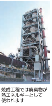
焼成工程では廃棄物が熱エネルギーとして使われます

につながら、セメント事業の強みにもなっています。セメント事業が建築インフラ資源を供給する「動脈」とすれば、資源リサイクル事業は、産業や人々の生活から出た廃棄物を有効利用し、セメント製造に転換する「静脈」です。具体的に言えば、世の中の排出元と廃棄物や副産物を資源化するセメント工場をつなぐパイプ役を担っています。 セメント原料の代わりとなる原料系はすでに大部分が廃棄物に切り替わっています。一方、石灰などの熱工