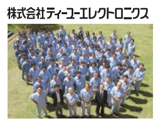
株式会社ティョーエレクトロニクス

当社は、瀬戸原工業団地内に工場を持ち、主に産業機械や医療機器などの制御装置に使用される電子回路用の「プリント基板」を製造しています。5Gスマホの普及や自動車の電動化などに伴い同基板の需要は年々高まっており、生産能力の増強へ日々取り組みんでいます。 社員数は現在100名強ですが、全員が宇部市とその近郊から