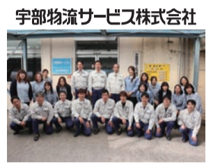
宇部物流サービス株式会社

ラーの整備や運行管理も業務の一つです。当社では市民の皆様にも大人気の車両を、丁寧に手入れしています。88t積の巨大な特殊車両です。一般道を走れません。構内で完結できるように整備工場や基地を設け安全第一の運行を支えています。英語のセメントという言葉には、「絆」という意味もあります。市民の皆様とも、固く「絆」を結び前進して参りますので、引き続きご支援下さいませ。よろしくお願い申し上げます。