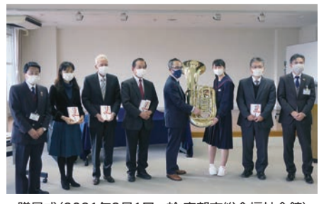
贈呈式(2021年3月1日、於:宇部市総合福祉会館)