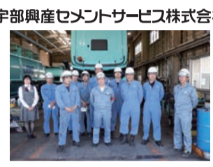
宇部興産セメントサービス株式会社

今後当社は、お客様の声を真摯に受け止め、「確実に・迅速に・誠実に」をモットーに、お客様、UBEグループ、地域のパートナーとしてお役に立てるよう努めて参ります。