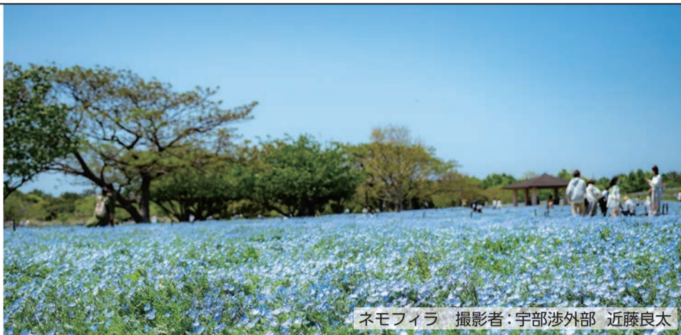
ネモフィラ