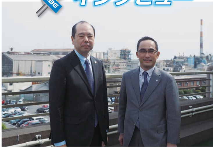
左：泉原社長 右：野嶋常務執行役員

「私は山口県の出身のため、小学校のときに常盤公園に遠足にきたり、彦田翁記念体育館にバレーボールの試合に来たりしており、入社前から宇部とは関わりがありました。そのせいか宇部に来ると今でもどこかほっとします。入社直後、宇部で飲みに行った時に「支払はツケでいいです」と言われたことがあり(今はそんなことありませんが)、宇部市における宇部興産への信頼感が絶大なものであると感じ、感激しました。 N・・・私は入社するにあたって地元秋田から本州の端までほぼ日本を縦断することになりました。山口県行きのバスに乗りこんで、「下関まで40km」の道路標識を見たときには本当に遠くには