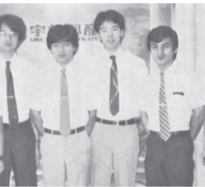
泉原社長(右から2番目) 新入社員時代の写真を当時の広報誌(興和)で発見! 本人に許可を得ずに勝手に掲載しています(笑)。

「私は山口県の出身のため、小学校のときに常盤公園に遠足にきたり、彦田翁記念体育館にバレーボールの試合に来たりしており、入社前から宇部とは関わりがありました。そのせいか宇部に来ると今でもどこかほっとします。入社直後、宇部で飲みに行った時に「支払はツケでいいです」と言われたことがあり(今はそんなことありませんが)、宇部市における宇部興産への信頼感が絶大なものであると感じ、感激しました。 N・・・私は入社するにあたって地元秋田から本州の端までほぼ日本を縦断することになりました。山口県行きのバスに乗りこんで、「下関まで40km」の道路標識を見たときには本当に遠くには