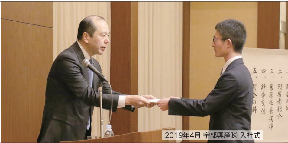
2019年4月 宇部興産(株) 入社式

「翼」は地域にお住まいのみならず、みなさまにUBEグループをより身近に感じていただくために発行しています。